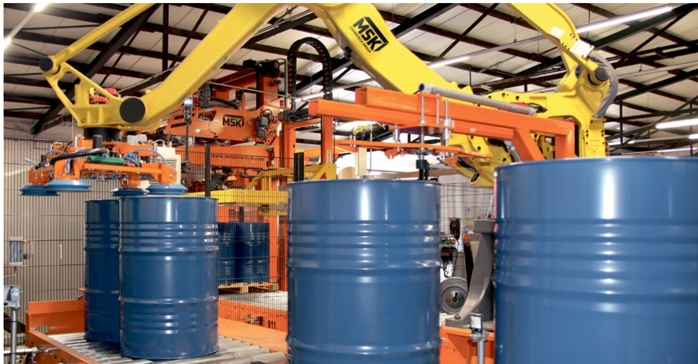
MSK Komplettanlage bei der Hemeyer Verpackungen GmbH, Werk Kleve