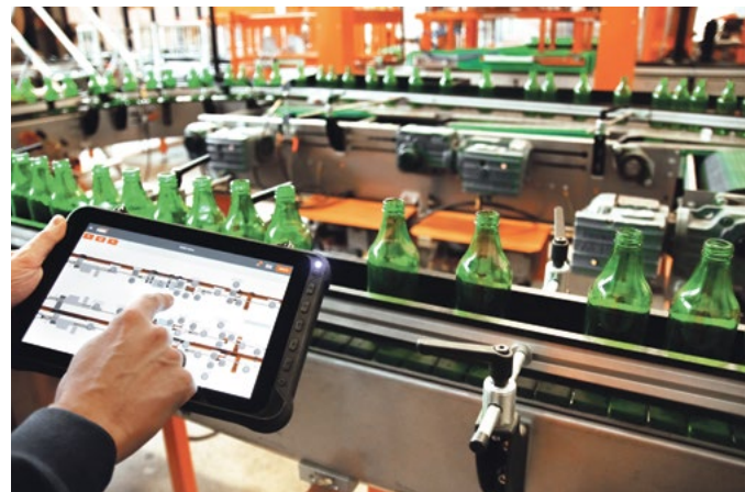
Durch den Einsatz eines modernen Industrietablets bietet MSK EMSY move Mobilität und Sicherheit bei der Bedienung von Nebenstellen einer Anlage